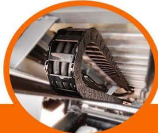
Riel plástico (Power Track) para proteger mangueras de winch y arnes eléctrico