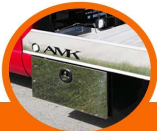
Caja de herramienta con puerta de acero inoxidable y chapa tipo JD