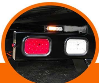
Par de módulos LED en caja de luces trasera