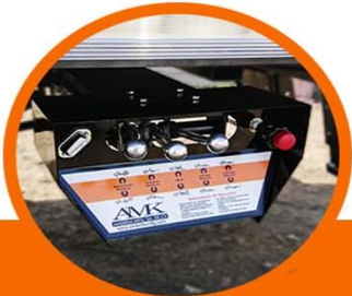
Cajas de control con iluminación LED Palancas de aluminio y Acelerador Remoto