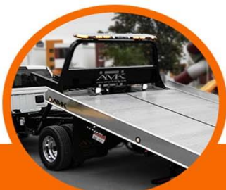
Torreta Whelen Justice de 60" 10 módulos LED ambar, stops y luces de trabajo