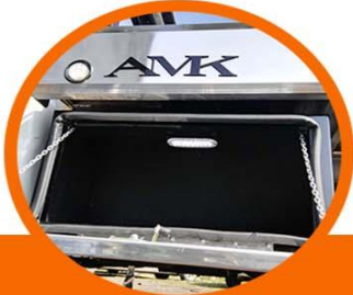
Caja de herramienta 36" x 18" con iluminación interior LED