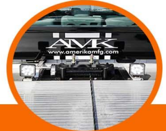
Winch hco. Ramsey 8,000 lbs con luces de trabajo LED