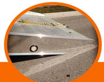
Acabado tipo "Cola de pato" ideal para autos de perfil bajo