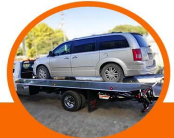
Plataforma de 12,000 lbs de capacidad acabado "tipo espejo"