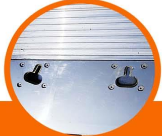
Keyslots Reforzados en parte Frontal y trasera de plataforma