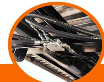
Válvulas doble Check en pistones de Levante de plataforma y Wheel Lift